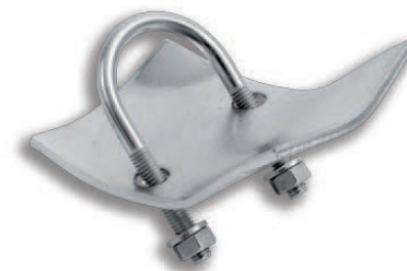
TABELLA DI SELEZIONE MORSETTI FISSATUBO MT