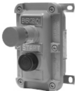
PB 2 1LV8R

Pulsantiera con pulsante di marcia luminoso e pulsante a fungo con sblocco a rotazione