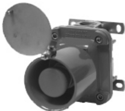
PB 1 8RP/D

Pulsantiera con pulsante a fungo e protezione in Alluminio con guardia in Acciaio Inox a disco