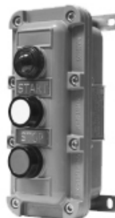
PB 3 01V

Pulsantiera con pulsante di arresto rosso, pulsante di marcia bianco e segnalatore luminoso